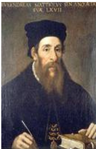
Siena 1501 - Trento 157

Medico e naturalista, esercitò la professione a Siena, Roma, Trento e Gorizia, divenendo medico personale di Ferdinando e Massimiliano